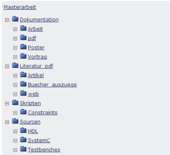
Abbildung 3.3: Beispiel für die Ordnerstruktur auf der CD

Die CD sollte den eingefrorenen Zustand Ihrer Arbeit enthalten. D.h. alle Quellen und Dokumentationen werden darauf abgespeichert. Im Anhang Ihrer Arbeit kann die Directory-Struktur der CD wie folgt abgebildet werden: